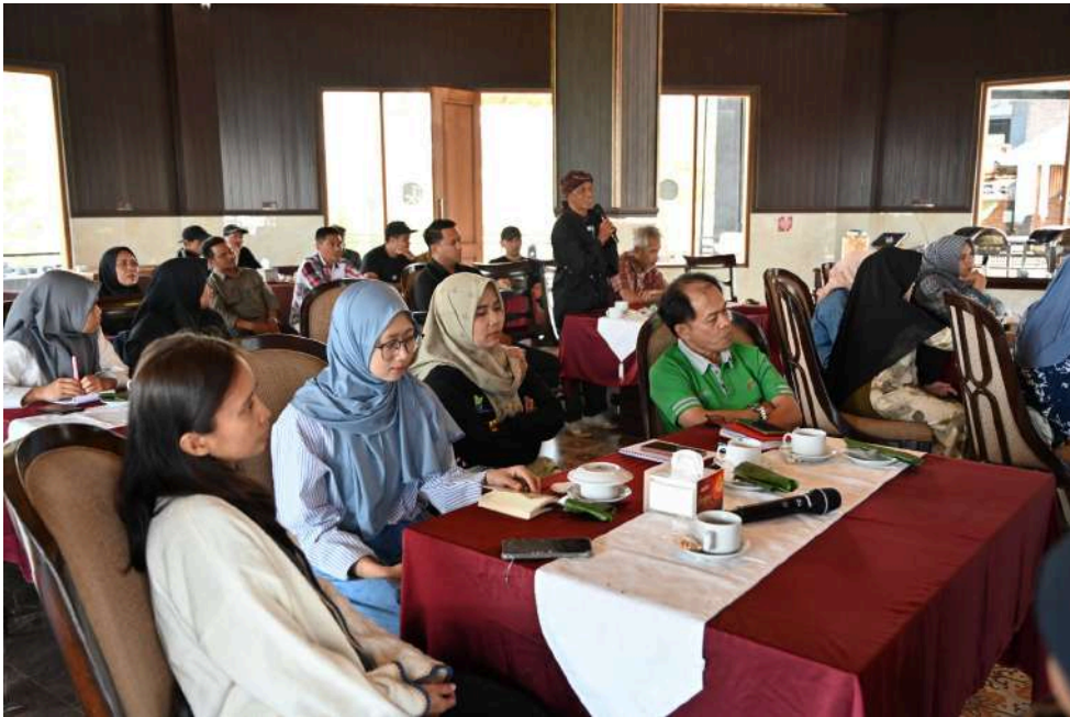
Keterangan Gambar : Kolaborasi Seluruh Elemen Demi Tingkatkan Daya Saing Pariwisata Temanggung

Temanggung, Media Center - Pemkab Temanggung melalui Dinas Kebudayaan dan Pariwisata (Dinbudpar) menggelar Rapat Koordinasi dan Peningkatan Kapasitas Pelaku Wisata yang ada di Kabupaten Temanggung, dengan tujuan agar pariwisata lokal mempunyai daya saing dengan pihak luar.