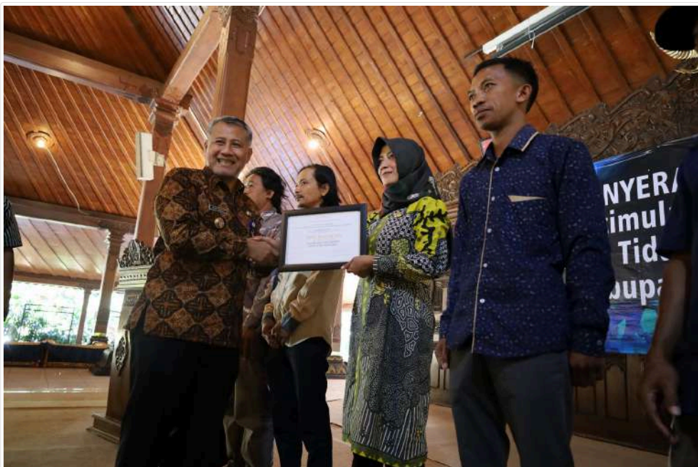
Keterangan Gambar : Pemkab Temanggung Berikan Bantuan Stimulan Peningkatan Kualitas RTLH

Temanggung, Media Center - Pemkab Temanggung, Jawa Tengah melalui Dinas Perumahan Rakyat, Kawasan Permukiman, dan Lingkungan Hidup (DPRKPLH) memberikan bantuan stimulan untuk 262 warga dengan Rumah Tidak Layak Huni (RTLH) agar diperbaiki menjadi lebih layak.