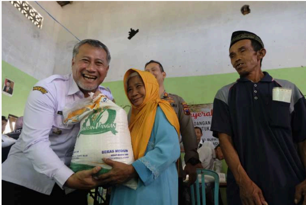
Keterangan Gambar : Bantuan Beras Cadangan Pangan Pemerintah (CPP) Kembali Disalurkan

Temanggung, MediCenter - Inspeksi mendadak dilakukan Tim Pengendalian Inflasi Daerah (TPID) Kabupaten Temanggung pada penyaluran beras Cadangan Pangan Pemerintah (CPP) di Desa Kemloko, Gentan dan Gesing.