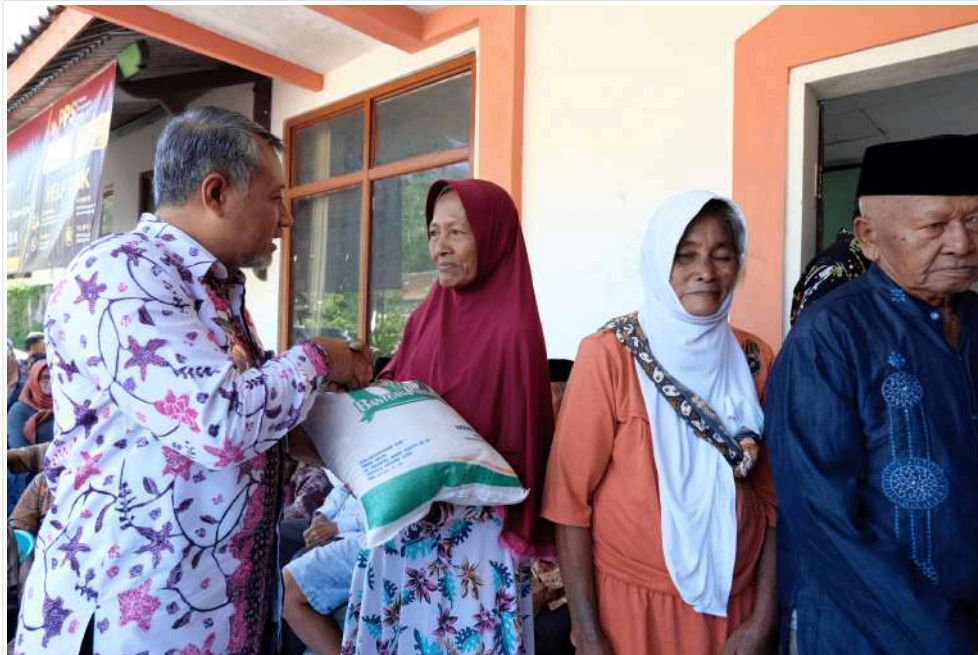
Keterangan Gambar : Pj. Bupati dan Forkopimda Pastikan Bantuan CPP Tepat Sasaran

Temanggung, Media Center - Tim Pengendalian Inflasi Daerah (TPID) Kabupaten Temanggung melaksanakan pemantauan penyaluran bantuan Cadangan Pangan Pemerintah (CPP) berupa beras di Desa Bojonegoro, Kecamatan Kedu, Temanggung, Kamis (6/6/2024).