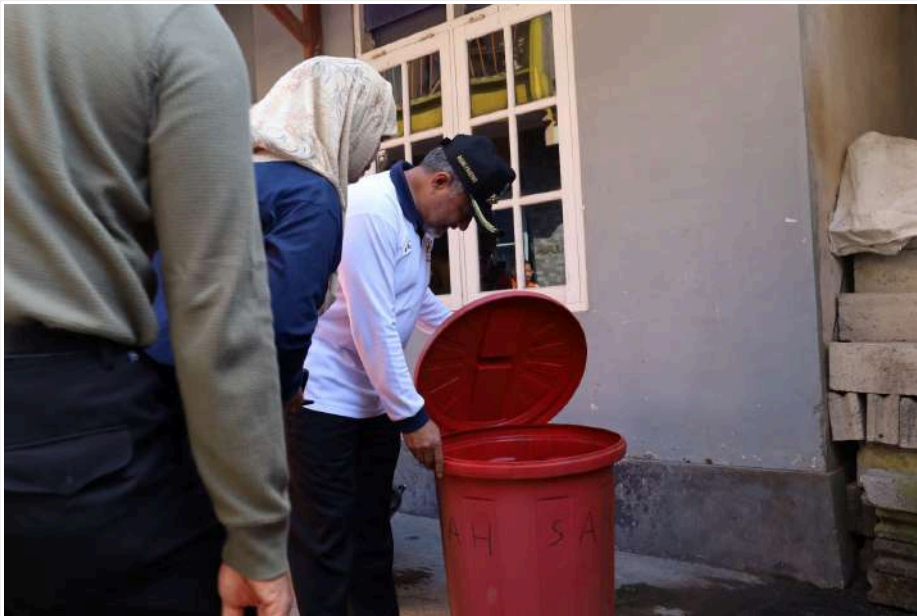
Keterangan Gambar : Atasi dan Antisipasi DBD, Pemkab Temanggung Galakkan PSN 3M-Plus

Temanggung, MediaCenter - Pj. Bupati Hary Agung Prabowo memimpin Gerakan Serentak Pemberantasan Sarang Nyamuk (Gertak PSN) 3M-Plus yang dilangsungkan di Dusun Sanggrahan, Desa Mojotengah, Kecamatan Kedu, Temanggung, Jumat (5/7/2024) pagi.