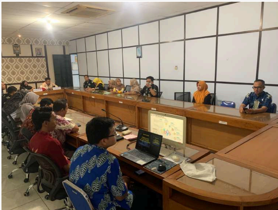
Keterangan Gambar : Optimalisasi Kanal Non-Tunai, BPKPAD Sosialisasi Pembayaran PBB

Temanggung, Media Center – Badan Pengelolaan Keuangan, Pendapatan, dan Aset Daerah (BPKPAD) Kabupaten Temanggung mengadakan sosialisasi pembayaran PBB non-tunai kepada staff ASN Dinkominfo di Aula Dinkominfo Kabupaten Temanggung, Kamis (18/07/2024) siang.