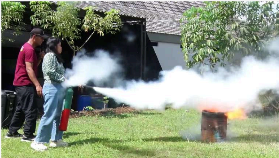
Keterangan Gambar : Ibu-ibu rumah tangga mengikuti pelatihan dan simulasi penanggulangan bencana kebakaran kepada ibu rumah tangga, Senin (8/7/2024).

Temanggung, Media Center - Dinas Satuan Polisi Pamong Praja (Satpol PP) dan Pemadam Kebakaran (Damkar) Kabupaten Temanggung memberikan pelatihan dan simulasi penanggulangan bencana kebakaran kepada ibu rumah tangga, Senin (8/7/2024).