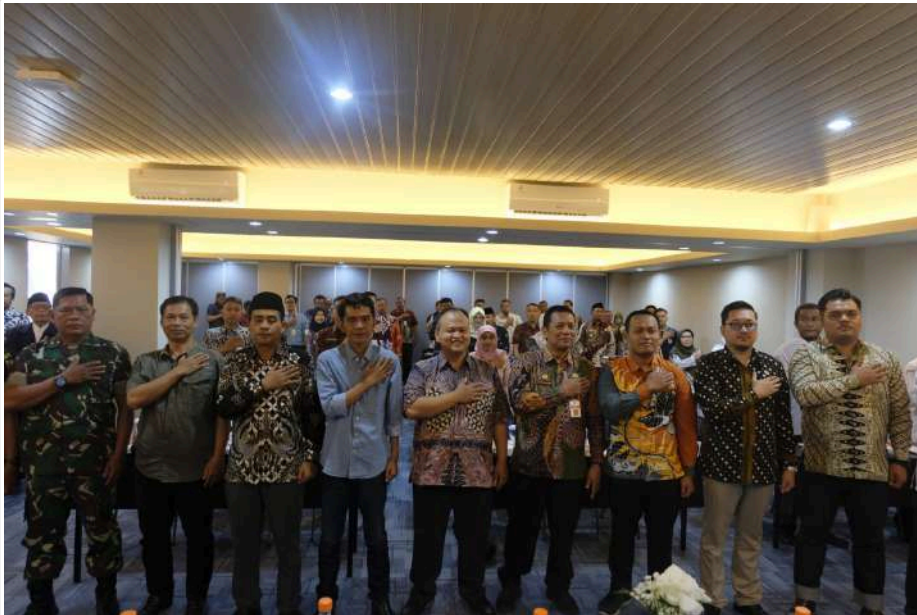
Keterangan Gambar : Sosialisasi Tahapan Pilkada 2024, Pj. Sekda Berpesan ASN Jaga Netralitas

Temanggung, MediaCenter - KPU Kabupaten Temanggung menggelar Sosialisasi Tahapan dan Jadwal Penyelenggaraan Pilkada Serentak Tahun 2024, di Front One Indraloka Temanggung, Kamis (1/8/2024).