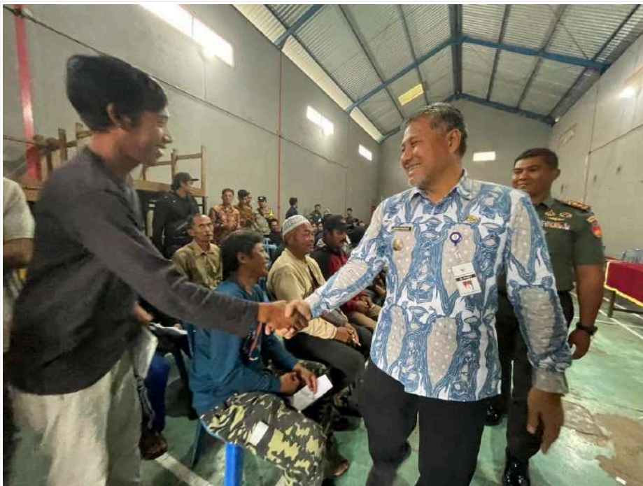
Keterangan Gambar : Kendalikan Inflasi, Pemkab Temanggung Beri Bantuan Pangan dan TPID

Temanggung, MediaCenter - Dalam rangka menekan laju inflasi yang bisa berdampak pada perekonomian dan daya beli masyarakat, Pemerintah Kabupaten Temanggung memberikan bantuan cadangan beras pemerintah untuk bantuan pangan dan TPID. Kali ini, bantuan diberikan di Desa Samiran, Kecamatan Kandangan, dan Desa Wonotirto, Kecamatan Bulu.