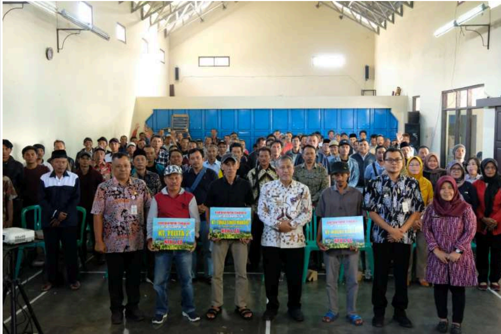
Keterangan Gambar : penyerahan dan sosialisasi bantuan pupuk tembakau diberikan kepada kelompok tani tembakau

Temanggung, Media Center - Secara simbolis, penyerahan dan sosialisasi bantuan pupuk tembakau diberikan kepada kelompok tani tembakau dalam kegiatan pengawasan dan penggunaan sarana pertanian DBHCHT APBD II Tahun Anggaran 2024 Kabupaten Temanggung di Balai Desa Traji, Kecamatan Parakan, Temanggung, Jawa Tengah, Selasa (7/5/2024).