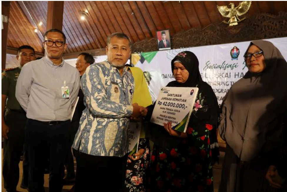
Keterangan Gambar : Sosialisasikan BLT dan Serahkan Santunan Jaminan Kematian, Pemkab Harap Pemanfaatan Untuk Modal Usaha

Temanggung, MediaCenter – Pemkab Temanggung melalui Dinas Sosial menyelenggarakan kegiatan Sosialisasi Dana Bagi Hasil Cukai Hasil Tembakau (DBHCHT) dengan agenda sosialisasi Bantuan Langsung Tunai (BLT), Launching Program Jaminan Sosial Ketenagakerjaan dengan pemberian kartu BPJS Ketenagakerjaan bagi buruh tani tembakau dan pekerja rentan, serta penyerahan Santunan Jaminan Kematian secara simbolis kepada empat ahli waris pekerja rentan dan satu ahli waris aparaturnya di Pendopo Pengayoman, Selasa (23/7/2024) pagi.