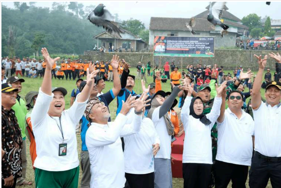
Keterangan Gambar : Inovasi dan Prinsip Keadilan Pegang Peran Penting dalam Krisis Iklim

Temanggung, MediaCenter - Inovasi dan prinsip keadilan memegang peran penting dalam upaya penyelesaian krisis iklim.