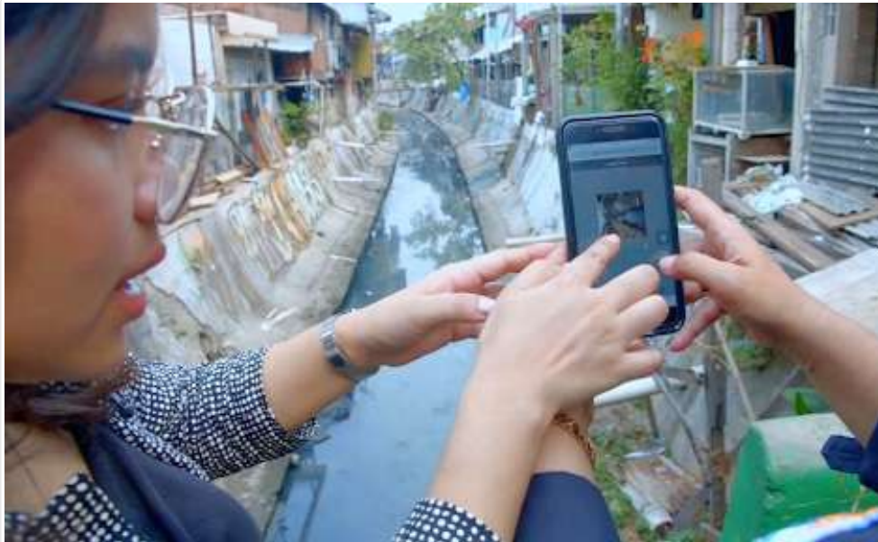
Keterangan Gambar : Penggunaan perangkat artificial intelligent (AI)

Jakarta, MediaCenter - Pada Hari Kesiapsiagaan Bencana (HKB) yang jatuh pada 26 April lalu, masyarakat berkesempatan untuk menggunakan perangkat artificial intelligent (AI). Lebih dari 75 organisasi di seluruh Indonesia mempraktikkan untuk melatih kesiapsiagaan komunitas.