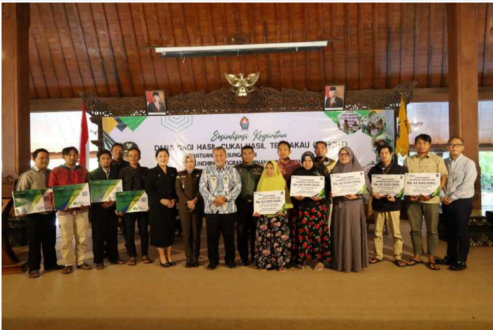
Keterangan Gambar : Fasilitas Penyaluran Jaminan Sosial dengan DBHCHT, Pemkab Temanggung Jadi Inisiator Pertama di Jawa Tengah

Temanggung, MediaCenter - Pemkab Temanggung menjadi kabupaten/kota pertama di wilayah Jawa Tengah yang menerapkan sistem pemberian Jaminan Sosial Ketenagakerjaan kepada Pekerja Rentan dengan pembiayaan yang berasal dari Anggaran Pendapatan dan Belanja Daerah (APBD) dan Dana Bagi Hasil Cukai Hasil Tembakau (DBHCHT).