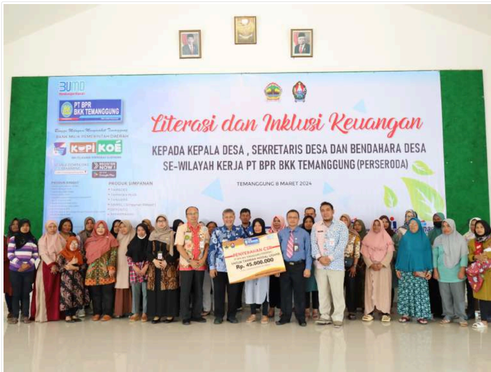
Keterangan Gambar : Tingkatkan Akuntabilitas Pengelolaan Keuangan Melalui Literasi dan Inklusi Keuangan

Temanggung, Media Center - Pj. Bupati Temanggung Hary Agung Prabowo secara langsung membuka "Kegiatan Literasi dan Inklusi Keuangan" kepada Kepala Desa, Sekretaris dan Bendahara Desa se-wilayah kerja PT. BPR BKK Temanggung (Perseroda) yang berlangsung di Gedung Babussalam, Komplek INISNU, Kowangan Temanggung, Jum'at (8/3/2024).