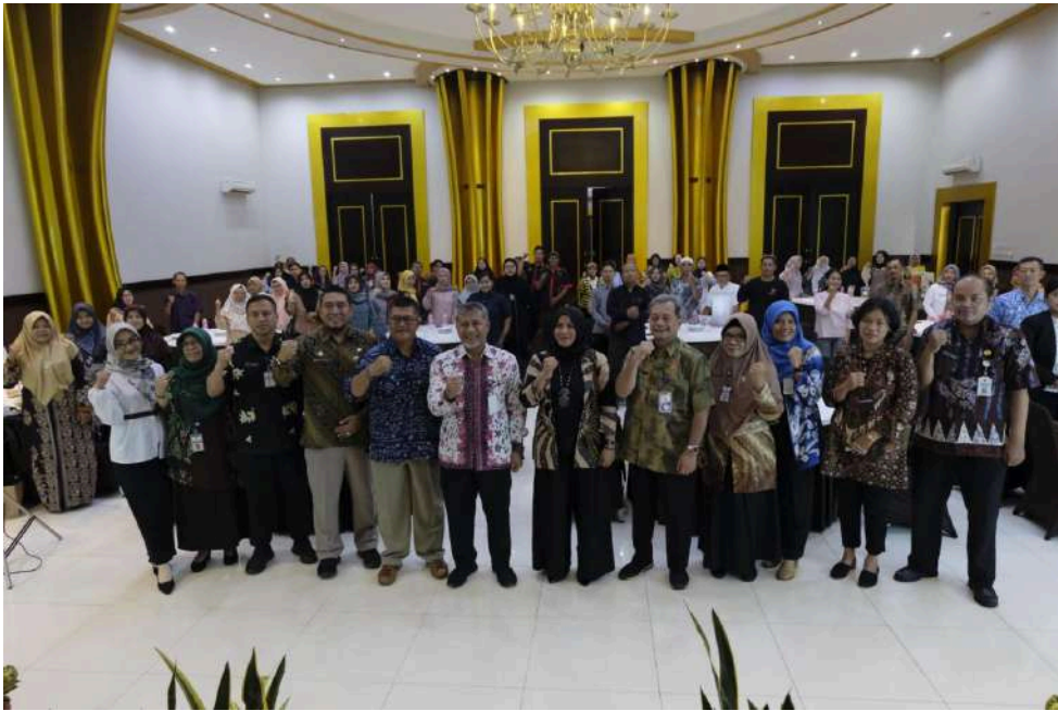
Keterangan Gambar : Forum Investasi Temanggung, Wadah Diskusi Peran UKM dalam Pertumbuhan Ekonomi