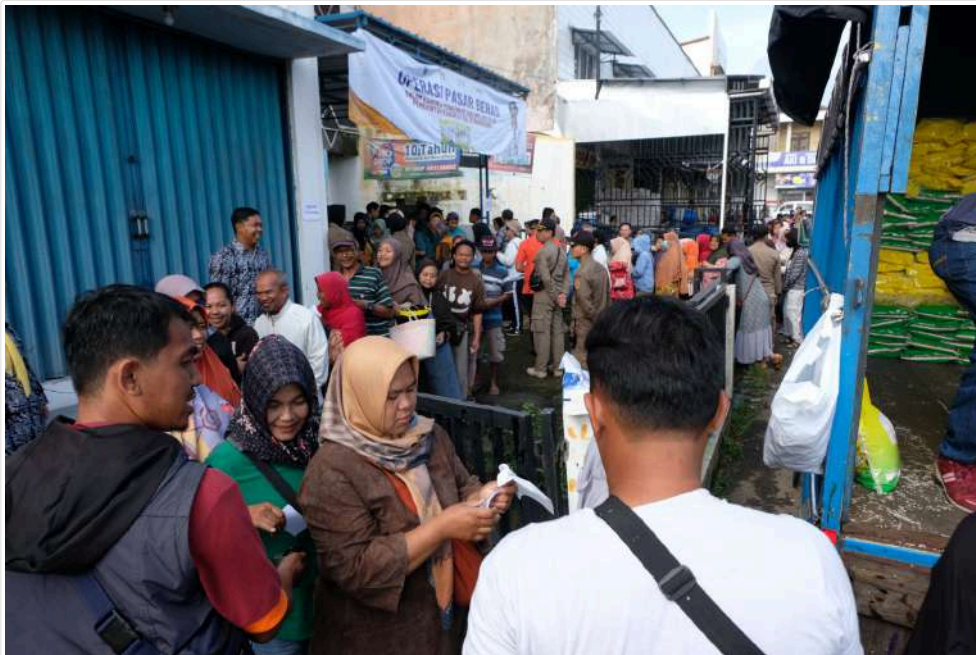
Keterangan Gambar : Pemkab dan Bulog Kembali Adakan Operasi Pasar Beras di Parakan

Temanggung, Media Center – Pemerintah Kabupaten Temanggung bekerjasama dengan Badan Urusan Logistik (Bulog) menggelar kembali Operasi Pasar Beras Stabilisasi Pasokan dan Harga Pangan (SPHP) dalam rangka Pengendalian Inflasi bertempat di Plaza Pasar Parakan Temanggung, Kamis (22/02/2024).