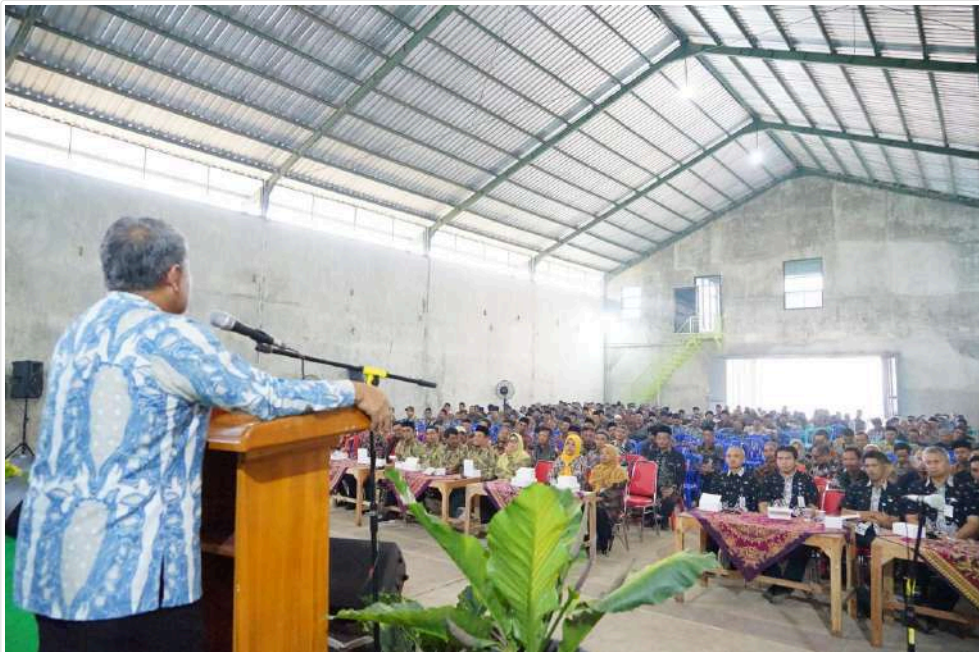
Keterangan Gambar : Pj. Bupati : Kepala Desa dan BPD Harus Bersinergi untuk Sejahterakan Masyarakat