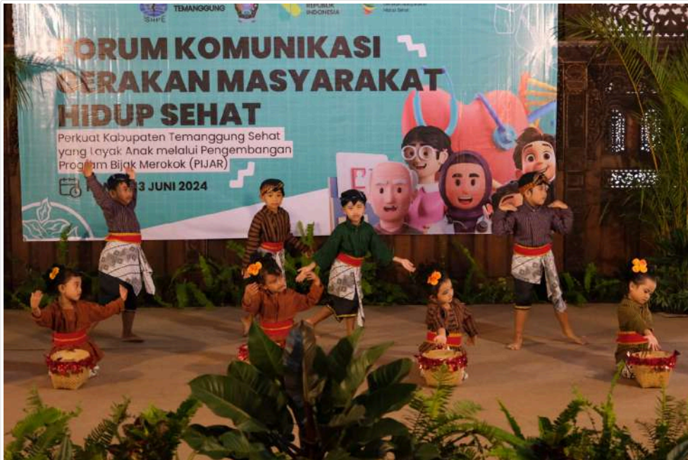
Keterangan Gambar : PIJAR, Upaya dan Strategi Mewujudkan Temanggung KLA dan KKS

Temanggung, MediaCenter - Pemkab Temanggung mendukung Program Bijak Merokok (PIJAR) sebagai salah satu upaya menuju Temanggung Kabupaten Layak Anak (KLA) dan Temanggung Kabupaten/Kota Sehat (KKS) yang telah dideklarasikan.