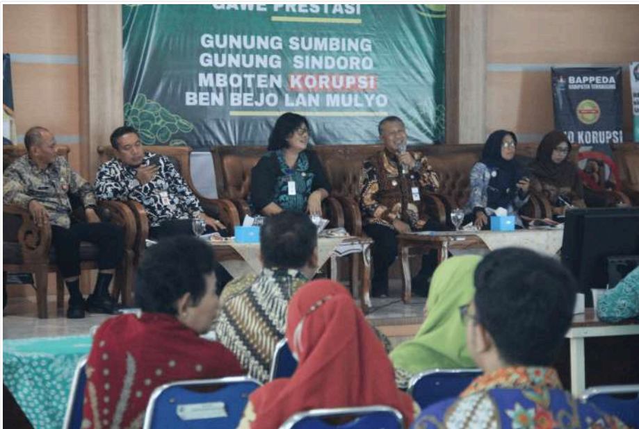
Keterangan Gambar : Fokuskan Intervensi Stunting, Temanggung Luncurkan Sripanggung

Temanggung, MediaCenter - Percepat Penurunan Stunting, Pemkab Temanggung melakukan Rapat Koordinasi, bertempat di Aula Progo Bappeda, Kamis (16/5/2024).