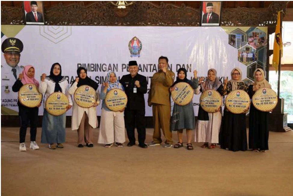
Keterangan Gambar : Pemkab Temanggung Salurkan Bantuan KUBE Sebesar 1,4 Miliar

Temanggung, Media Center - Pemerintah Kabupaten Temanggung, Jawa Tengah melalui Dinas Sosial menyalurkan bantuan permodalan bagi 141 Kelompok Usaha Bersama (KUBE), Senin (15/7/2024).